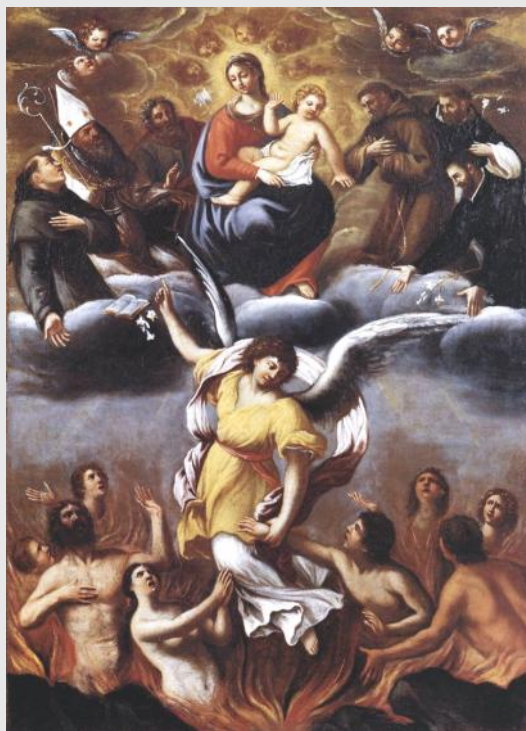
Ludovic Carrache, Un ange délivre les âmes du Purgatoire , vers 1610, Pinacothèque Vaticane